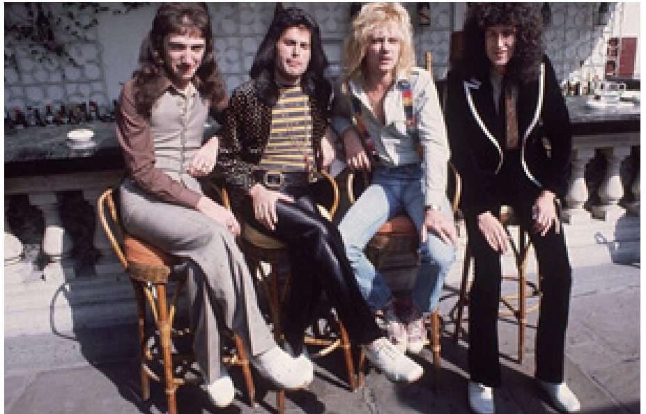
Queen au grand complet au début de leurs carrières. (On le voit grâce à leur coupe de cheveux!) John Deacon, bassiste du groupe, ici à droite de la photo.