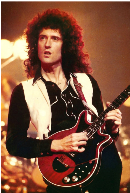
Bryan May, guitariste de Queen (en haut). Roger Taylor, batteur du groupe (en bas).