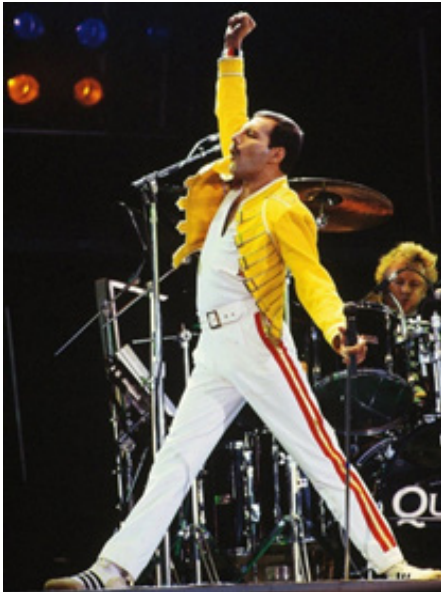
Mercury à son concert de Queen, en 1986, au Wembley Stadium.