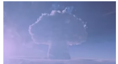
Le champignon atomique créé par la "Tsar bomba" après son explosion.

Cela traduit donc la puissance surhumaine de cette bombe, dans le contexte de course à l'armement.