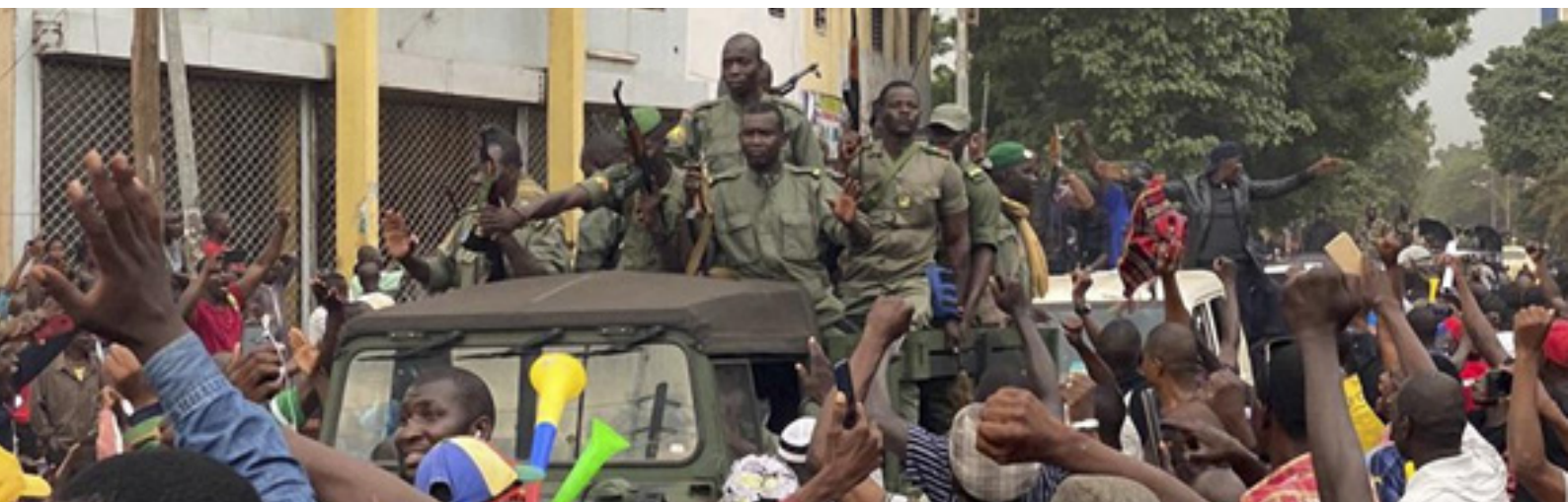
La foule de manifestants fête l'arrivée de militaires maliens sur la place de l'Indépendance à Bamako (Mali), lors d'un coup d'État militaire, le 18 août 2020.

Le Mali, État d'Afrique de l'Ouest de 20 millions d'habitants, est fragilisé depuis 2012 à cause de l'occupation de groupes rebelles touaregs ainsi que par l'apparition de groupes terroristes, dans le nord du pays. En août, le Président est arrêté par des militaires réunis au sein du Comité National pour le Salut du Peuple (CNSP), puis démissionne. Le Mali présente un avenir incertain. La France est, avec l'opération Barkhane, impliquée depuis 2014 militairement au Mali afin de lutter contre les milices séparatistes. On compte 40 morts français depuis le début des opérations.