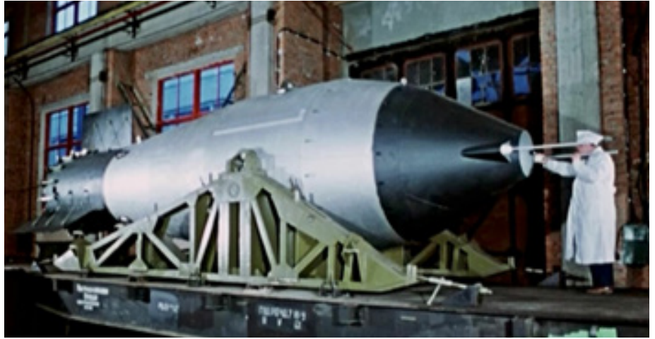
La "Tsar Bomba" lors de son assemblage en usine et peu avant son largage.

Il faut bien évidemment se rappeler que dans les années 60 nous sommes en pleine Guerre Froide, sur ce fait la course à l'armement a atteint son paroxysme avec l'arrivée de la bombe la plus puissante jamais fabriquée. Cette bombe, c'est la "Tsar Bomba", ou de son vrai nom RDS-220, pesant 17 tonnes et mesurant 8m de long pour 2m de diamètre, soit l'équivalent d'un bus. Elle est en mesure de délivrer une puissance de 57 mégatonnes, soit 3800 fois la puissance des bombes d'Hiroshima et de Nagasaki. Larguée par un bombardier de haute altitude Tupolev TU-95V Soviet, la bombe explose à 4000 mètres d'altitude au dessus de la Mer de Barents, non loin de l'île de Severny. S'ensuit un flash aveuglant puis un immense champignon s'élevant dans le ciel. Il est même dit que l'avion transportant la bombe fit une chute vertigineuse avant de se redresser suite à l'onde de choc qui frappa l'appareil. Par la suite, le diamètre de ce champignon était de 97 km avec une hauteur de 67 km, soit 7 fois la hauteur du Mont Everest ! Le champignon créé par l'explosion de la bombe fut visible à 1000 km à la ronde (même si, ce jour-là, il faisait un temps exécrable). La bombe détruisit tout dans un rayon de 55 km, son onde de choc fit 3 fois le tour de la Terre et elle provoqua même un tremblement