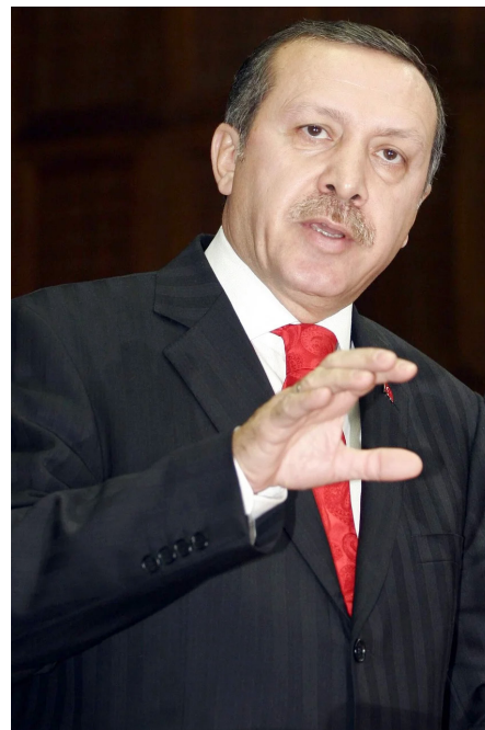
Le Président turc, Recep Tayyip Erdoğan, élu depuis 2014.

En dépit de ces complications, les différents acteurs du conflit ont récemment opté pour la voie du dialogue. L'Allemagne a joué un rôle clé dans l'apaisement des tensions, et un sommet devrait être prochainement organisé. Mais de toute évidence, la Turquie ne va pas renoncer à ses prétentions régionales. Son interventionnisme en Libye, mais aussi en Syrie et en Irak, agite pour certains le spectre d'un empire ottoman pourtant disparu.